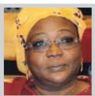
Fatouma Alassane Directrice des Postes et de l'Épargne Ministère de la Communication et des NTI Niger